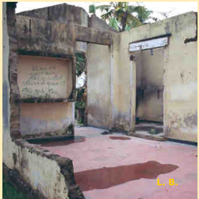
Imatge presa el gener de 2007 d'una edificació a la ciutat de Galle, al sud del país, on hi van morir 3.724 persones

La situació, però dista de ser idònia i obliga a les ONGs a treballar en unes condicions de vulnerabilitat que també pateixen els habitants d'una illa que somia en arribar a una pau definitiva.