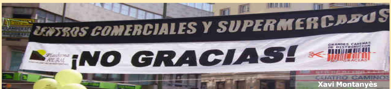
17 d'abril, Dia internacional de lluita pagesa, presentació de la campanya a Madrid

Tot i que aquestes corporacions s'esforcen per construir una imatge en positiu per augmentar les seves vendes finançant actes públics o incloent productes del Comerç Just i l'agricultura ecològica, el cert és que els pobles d'arreu del món pateixen transformacions socials que limiten la seva llibertat i posen en perill el seu dret a l'alimentació.