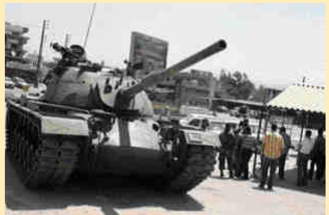
Exèrcit libanès a l'entrada de Nahr al Bared, juny 2007

Fatah al Intifada es distingia per una dimensió política que aglutinava les parts