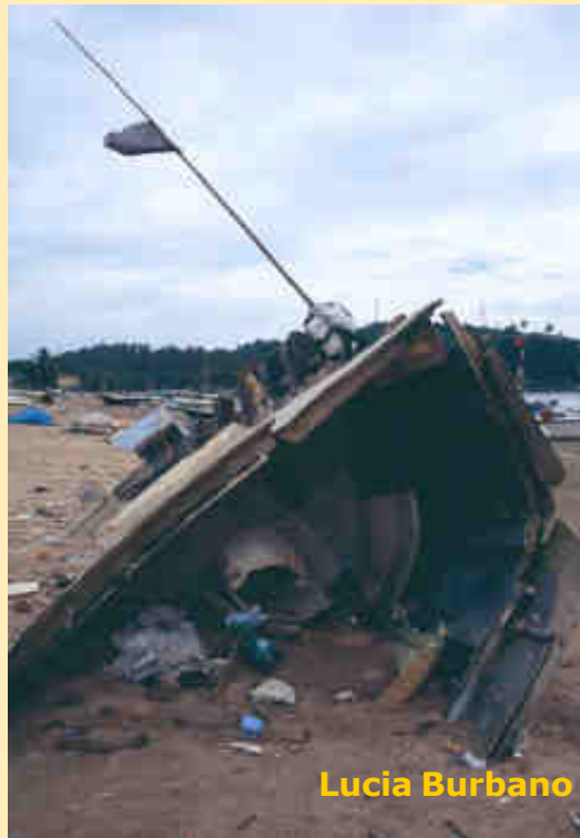
La comunitat de pescadors va ser una de les més afectades