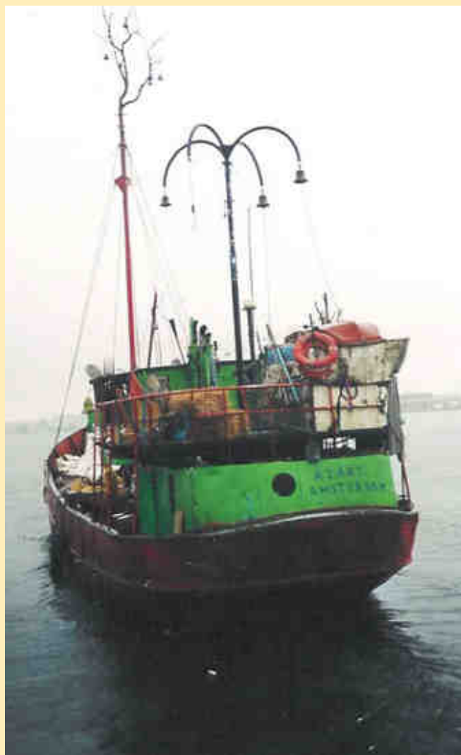
El vaixell navegant a la deriva, juny 2007

Aquesta és una de les impressions que Dirks ha tingut de Barcelona durant el mes i mig en què han estat a la ciutat.