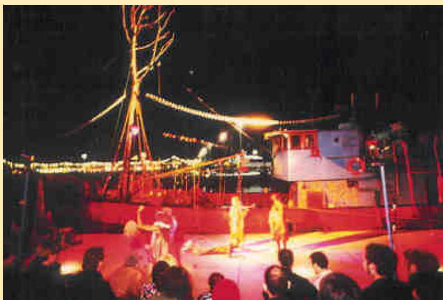
Els bojos en un dels seus espectacles a un port d'arreu del món

Azart és un col·lectiu d'artistes, actors, dissenyadors, músics i tècnics, peregrins de l'art que busquen altres formes d'explorar la comunicació humana i que fan el seu viatge pel món en forma de processó festiva. Però fa segles, Azart va ser un ambaixador subcultural d'Amsterdam que es va formar en les tradicions marítimes de la ciutat i que seguia les antigues rutes mercantils de les Índies. Anys després, el vaixell dels bojos ha seguit la seva estela, aquesta vegada per promoure intercanvis culturals, així com la cooperació artística entre tots els continents del món.